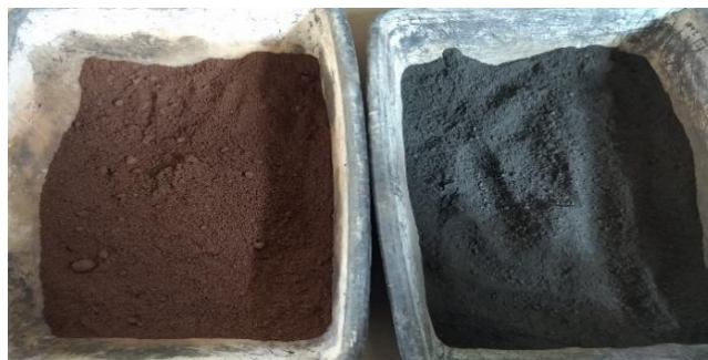
Figura 1: Amostra de rejeito de ferro (a) e cobre (b)

A partir da granulometria, avaliamos as estruturas visando a distribuição das frações para efeitos de estabilização granulométrica nas camadas de base, e composição do CBUQ (concreto betuminoso usinado a quente). No caso do CBUQ, o DNIT determina faixas adequadas ao projeto da camada de rolamento com valores limites mínimos e máximos aceitáveis por faixa granulométrica. Os rejeitos foram destorroados e peneirados para o ensaio de granulometria. Paralelamente também foram realizados ensaios em amostras comerciais de brita 1, brita 0, areia e pó de pedra visando posteriormente a composição do CBUQ. O ensaio é normatizado pela NBR 7181/2016 para solos e norma DNIT 412/2019 para o CBUQ. Os resultados de granulometria foram apresentados no Quadro I.